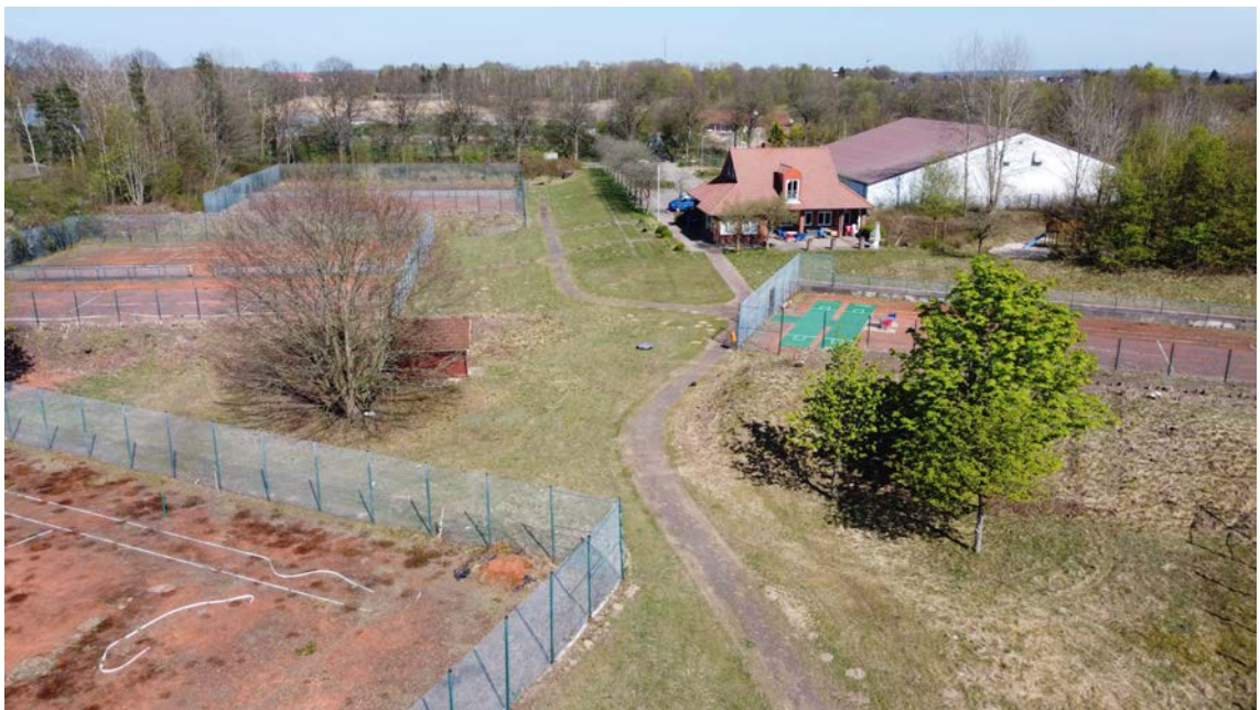
Abbildung 1: Blick von Westen auf den Geltungsbereich in Richtung der Schirnauallee

Der Geltungsbereich liegt im westlichen Stadtgebiet innerhalb des Erholungsparks an der Schirnauallee, der östlich der Bundesautobahn 7 liegt. Das Plangebiet umfasst das Flurstück 1/21. Es wird in der Planzeichnung (Teil A) durch eine entsprechende Signatur gekennzeichnet und weist eine Fläche von etwa 1,17 ha auf.