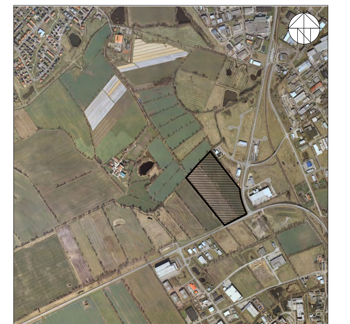
Übersichtsplan 1 : 15.000

Aufgrund des § 10 des Baugesetzbuches (BauGB) sowie nach § 84 der Landesbauordnung (LBO) wird nach Beschlussfassung durch die Stadtvertretung vom 18.10.2011 folgende Satzung über den Bebauungsplan Nr. 61, vereinfachte Änderung "Westerwohld Nord", für den Bereich: nördlich der L 326 und westlich der Hamburger Strasse, bestehend aus der Planzeichnung (Teil A) und dem Text (Teil B), erlassen.