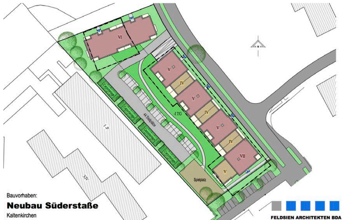
Abb. 1: Lageplan Vorhabenplanung, Stand Januar 2017 (Feldsien Architekten BDA)

Das Bebauungskonzept sieht im Norden des Geltungsbereiches ein 6-geschossiges und entlang der Süderstraße ein langgestrecktes Mehrfamilienhaus mit mehreren Eingängen vor.