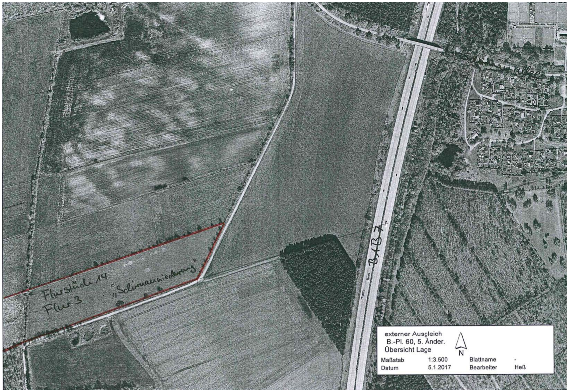
Abb. 2: Lage der Ausgleichsfläche (Schirnauniederung)