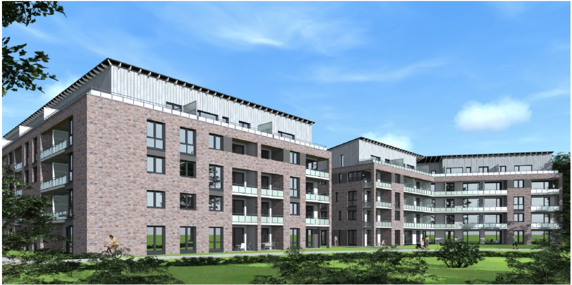
Abbildung 2: Ansicht von Südwesten, Architekten Feldsien, Kaltenkirchen, 01/2018