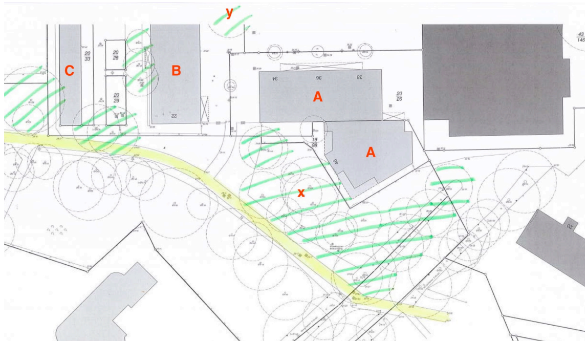
Abbildung 4: Übersicht über die untersuchten Gebäude (A - C) und Bäume (grün schraffiert)

In der folgenden Abbildung sind die auf Quartiere untersuchten Gebäude und Bäume dargestellt.