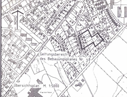
Übersichtsplan M. 1:5000